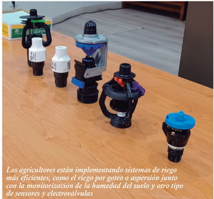
Los agricultores están implementando sistemas de riego más eficientes, como el riego por goteo o aspersión junto con la monitorización de la humedad del suelo y otro tipo de sensores y electroválvulas

cos y maximizar la eficiencia, convirtiendo lo que antes se consideraban desechos en recursos valiosos. En un entorno agrícola donde cada recurso cuenta, la economía circular se ha convertido en una parte integral de la estrategia de sostenibilidad agrícola. El compostaje se ha convertido en una herramienta esencial en la economía agrícola circular. Los agricultores y ganaderos están aprovechando los residuos orgánicos, como restos de cultivos y estiércol, para producir compost de alta calidad. Este compost no solo enriquece el suelo con nutrientes naturales, sino que también mejora su estructura y capacidad de retención de agua. Además, la reutilización de residuos orgánicos reduce la necesidad de fertilizantes quími-